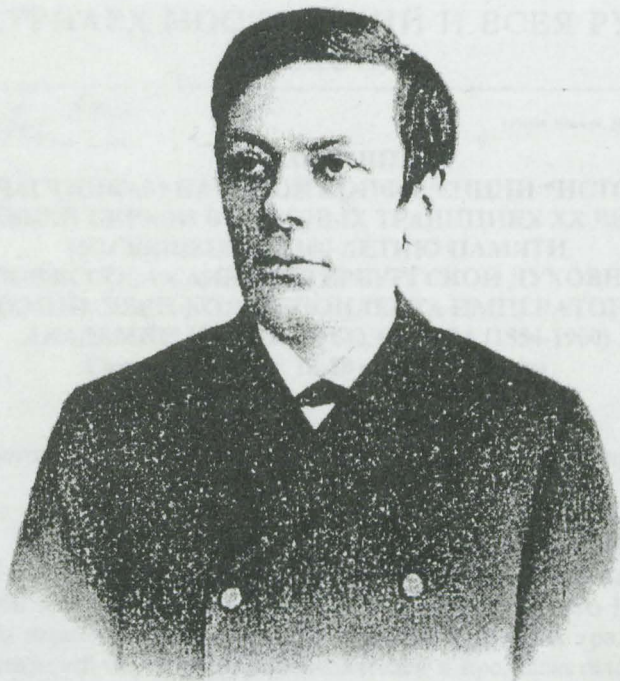
Профессоръ Василій Болотовъ