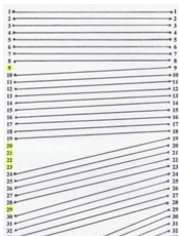
Рис. 1. Схема соотношения порядка описания поселений в дозорных книгах 1582/83 и 1619/20 гг.

Для ответа на вопрос, были ли книги дозора 1584 г. приправочными для отдельных книг 1613/14 г., необходимо выяснить, по каким признакам, кроме непосредственного указания в тексте, можно установить такое соотношение. Например, известно, что приправочными книгами для дозора 1619/20 г. были книги 1582/83 г. При сопоставлении порядка описания населенных пунктов в этих двух источниках наблюдается соответствие в порядке описания. Для наглядности нами были построены графические схемы. Приведем фрагмент такого построения 32 . На рис. 1 можно увидеть, что в целом порядок описания поселений в двух книгах совпадает, но некоторые из них не были описаны во время дозора 1619/20 г.